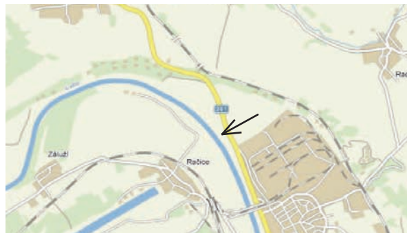
Lokace MVE Štětí.

(Podrobněji přílohy: Energetický audit a Studie proveditelnosti zpracované SEVEn, střediskem pro efektivní využívání energie.)