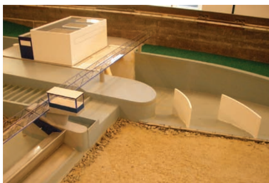
Detail fyzikálního modelu koryta Labe pro hydraulický výzkum nátoky.

Veškerá příprava je zajištěna nejen prostřednictvím odborných firem, jako je Pöyry Environment, a.s., ale také v úzké spolupráci s VUT Brno Fakultou stavební – laboratoří vodohospodářského výzkumu Ústavu vodních staveb a ČVUT Praha Katedrou hydrotechniky.