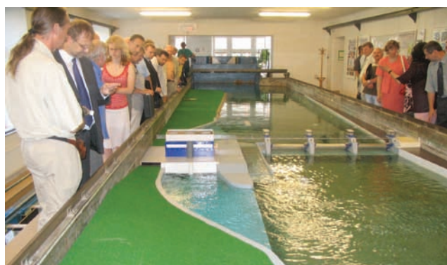
Prezentace fyzikálního modelu pro partnery a odbornou veřejnost na VUT v Brně.