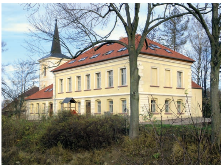
Budova respitní části komplexu dětského hospice

V tuto chvíli funguje respitní část dětského hospice , v horizontu příštích let plánujeme vybudování samostatné ošetrovatelské jednotky ; v tuto chvíli existuje nejen projekt, ale rovněž pravomocné stavební povolení, které zajistila a vlastní Energeia, o.p.s. Náklady na stavbu včetně kompletní vybavenosti jsou cca 100 mil. Kč, provozní náklady celého komplexu včetně nákladů mzdových odhadujeme na 20 mil. Kč ročně.