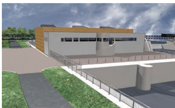
Vizualizace objektu MVE na pravé straně břehu

Projekt využívá zkušeností z realizací vodních elektráren při jezích na dolní Vltavě a Labi, a také poznatků získaných z povodní v srpnu 2002. Jedná se o instalaci ověřené technologie – dvě přímoproudé Kaplanovy turbíny v provedení PIT o průměru oběžného kola D 5,10 m s max. hltností obou turbín v souběhu 340 m 3 a celkovým výkonem – 5,2 MW; průměrná roční výroba je 31,5 GWh.